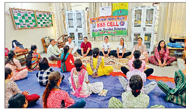
झज्जर। राजकीय महाविद्यालय दुजाना में योगाभ्यास करते हुए शिक्षक एवं विद्यार्थी।