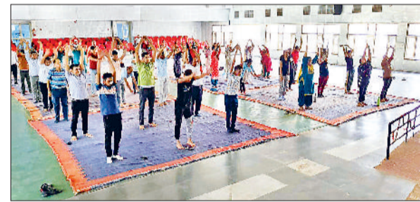
झज्जर। नेहरू कॉलेज में योगाभ्यास करते हुए विद्यार्थी एवं स्टाफ सदस्य।