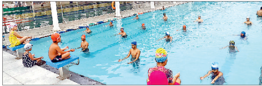
बहादुरगढ़। एचएल सिटी के स्विमिंग पूल में योग करते तैराक।