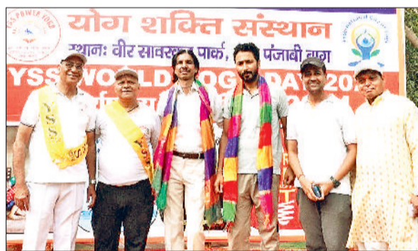
बहादुरगढ़। ट्रस्ट पदाधिकारियों को सम्मानित करते संस्थान के पदाधिकारी।

पंजाबी बाग के योग शक्ति संस्थान ने अंतरराष्ट्रीय योग दिवस के अवसर पर आयोजित कार्यक्रम में गऊमाता और जीवसेवा के लिए प्रयासरत संस्था गार्डियन ऑफ एंजल्स ट्रस्ट को सम्मानित किया गया। बहादुरगढ़ के नया गांव में पिछले 5 सालों से बीमार, लाचार, पीड़ित गौवंश और अन्य जीवों के इलाज के लिए समर्पित ट्रस्ट के उत्कृष्ट योगदान को सराहा गया।