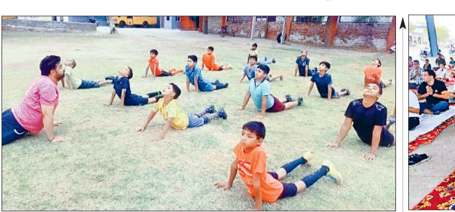
बहादुरगढ़। योगाभ्यास करते माउंट व्यू स्कूल के विद्यार्थी।