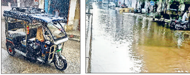
बहादुरगढ़। रिमझिम बरसात में सड़क से गुजरता ई-रिक्शा, बरसात के बाद झंझर रोड पर जमा बरसाती पानी।

तहां सड़कों और गलियों में पानी जमा हो गया। इससे लोगों को परेशानी का सामना करना पड़ा। हालांकि बारिश से तापमान में गिरावट के कारण गर्मी से राहत मिली। अभी कई दिनों तक मौसम में उठापटक बने रहने के आसार हैं।