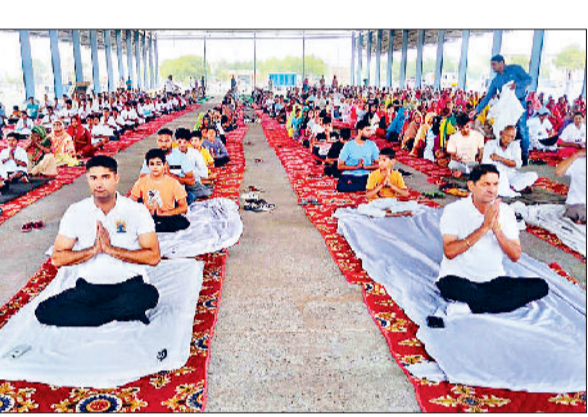
बेरी। कार्यक्रम के दौरान योगाभ्यास करते योगसाधक।