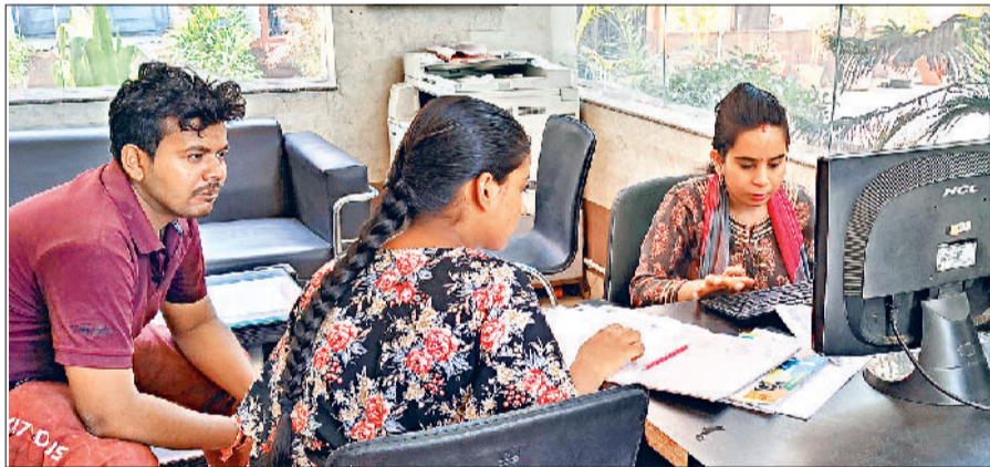
बहादुरगढ़। ऑनलाइन रजिस्ट्रेशन करवाते छात्र-छात्राएं।

इवनिंग की 200 सीटों के लिए 81, बीबीए की 40 सीटों के लिए 68, बीकॉम की 180 सीटों के लिए 76, बीसीए की 60 सीटों के लिए 163, बीएससी लाइफ साइंस की 60 सीटों के लिए 44 और बीएससी फिजिकल साइंस की 120 सीटों के लिए 43 रजिस्ट्रेशन हो चुके हैं। राजकीय महाविद्यालय बादली की मीडिया प्रभारी डॉ. पूनम ने बताया कि बीए में 400 सीटों के लिए 179, बीए भूगोल की 40 सीटों