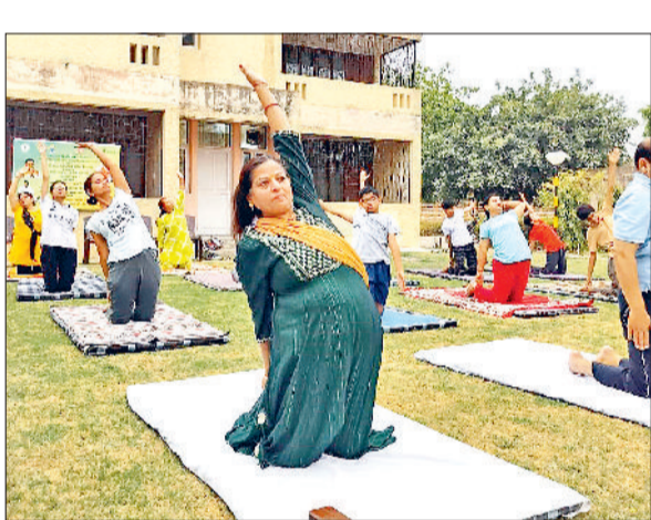
बहादुरगढ़। एचएनजी में योगाभ्यास करते स्थानी निवासी।