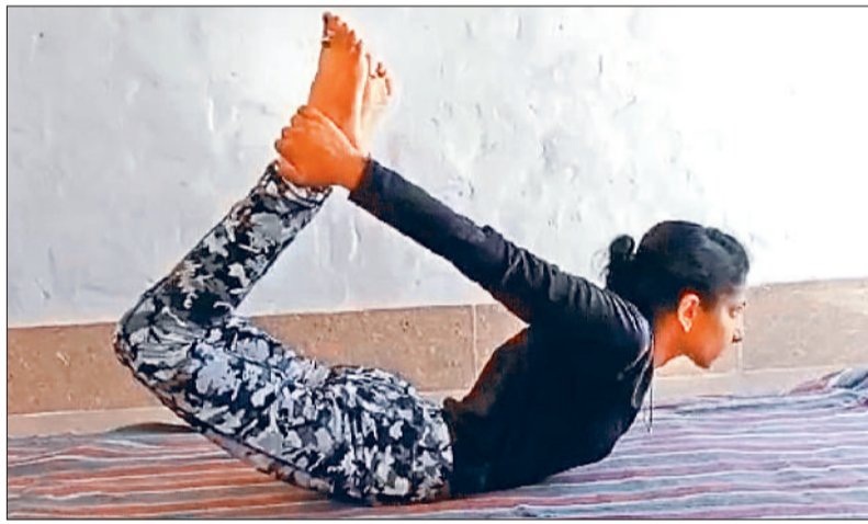
बहादुरगढ़। वर्चुअल प्रतियोगिता में योगाभ्यास करती एक छात्र।