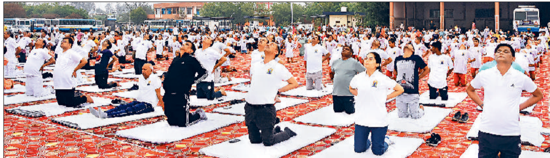
झज्जर। बस स्टैंड परिसर स्थित वर्कशॉप में योगाभ्यास करते हुए योगसाधक।

हजारों की संख्या में लोग योग कार्यक्रम में शामिल हुए और योग के विभिन्न आसनो का अभ्यास किया। कार्यक्रम में पीएम नरेंद्र मोदी व सीएम नायब सिंह के लाइव संबोधन भी हुआ। इस दौरान अपने संबोधन में मुख्यातिथि ने कहा कि कहा कि पीएम मोदी ने भारतीय परंपरा व संस्कृति के पहचान सदियों पुरानी योग को पूरी दुनिया के सामने लाने का महान कार्य किया है, जिसकी बदौलत आज समूचा