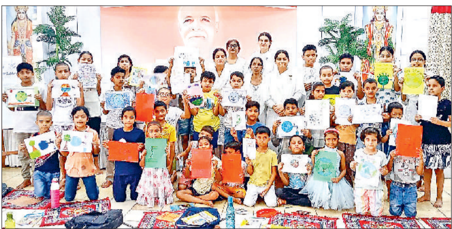
बहादुरगढ़। कार्यक्रम के दौरान ब्रह्माकुमारियों के साथ बच्चे।