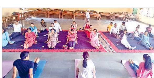
बहादुरगढ़। गर्ल्स कॉलेज में योगाभ्यास करती छात्राएं व स्टाफ।

बहादुरगढ़। अंतरराष्ट्रीय योग दिवस के मौके पर एसीपी धर्मवीर सिंह ने बच्चों व युवाओं को नशे के दुष्प्रभाव के बारे में जागरूक किया। नशा नहीं करने की शपथ दिलाते हुए योग करने की सलाह दी। उन्होंने युवाओं के बीच नशीली दवाइयों का दुष्प्रयोग बढ़ने पर चिंता जताई। शपथ दिलाई कि हम नशीली दवाओं के दुष्प्रयोग की रोकथाम के लिए सहयोग करेंगे।