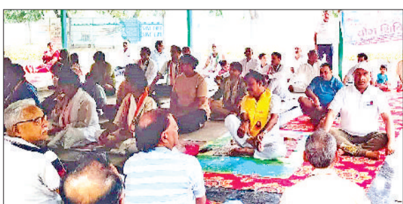
बहादुरगढ़। देवीलाल पार्क में योगाभ्यास करते भाविप सदस्य।