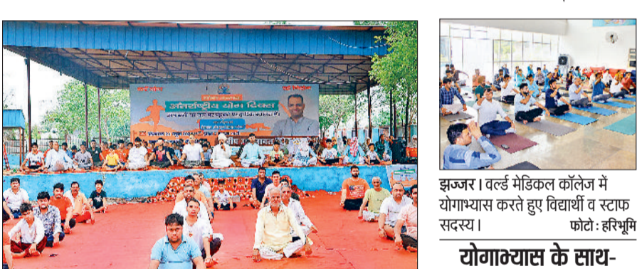
झज्जर। डीघल गांव में योगाभ्यास करते हुए ग्रामीण।