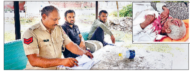
साल्हावास। नागरिक अस्पताल परिसर में पोस्टमार्टम के लिए कागजी कार्रवाई करते हुए पुलिसकर्मी व इनसेट में मंदिर परिसर में चारपाई पर पड़ा मृतक का शव।

क्षेत्र के गांव चांदौल के निर्मलदास मंदिर में तेजधार हथियार से पुजारी की हत्या की वारदात को अंजाम दिया गया। पुजारी का शव शुक्रवार सुबह मंदिर परिसर में चारपाई पर लहलुहान अवस्था में मिला। ग्रामीणों ने जब देखा तो उन्होंने मामले की सूचना पुलिस को दी। जिस पर कार्यवाई करते हुए पुलिस टीम मौके पर पहुंची और मामले की जानकारी ली। एफएसएल टीम ने भी मौके से साक्ष्य जुटाए। बाद