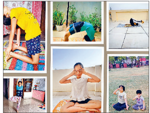
झज्जर। ऑनलाइन माध्यम से योग कार्यक्रम में भाग लेते विद्यार्थी।

स्वयंसेवियों को योग की महत्ता से अवगत कराया। कार्यक्रम में मौजूद सभी शिक्षकों व विद्यार्थियों ने योग प्रोटोकॉल के अनुसार योगाभ्यास किया।