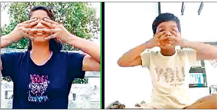
झज्जर। जूम एप के जरिए योगा कार्यक्रम में भागीदारी करते हुए विद्यार्थी।